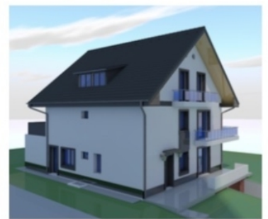
Utcafront felüli képek