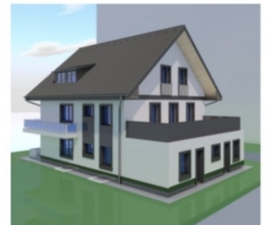
Hátsó kert felüli képek