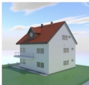
Hátsó kert felüli képek